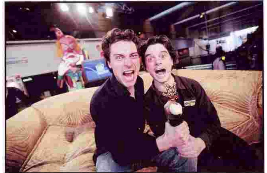
Expression de joie suite à la remise du Prix Fnac à Nantes Touchant, n'est-ce pas ?